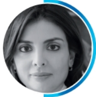
Najwa EL HAÏTÉ